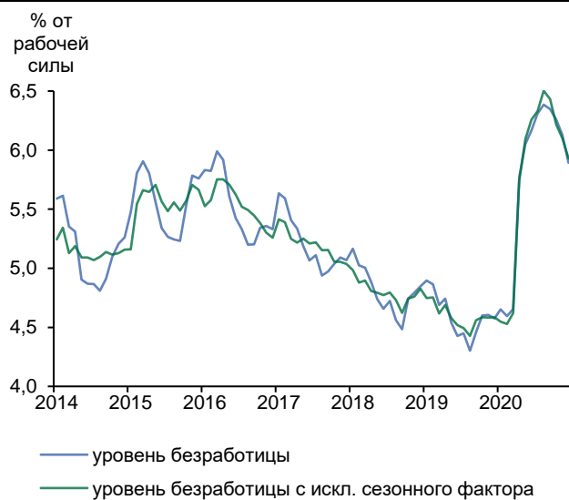
Рис. 3. Уровень безработицы снижается пятый месяц подряд